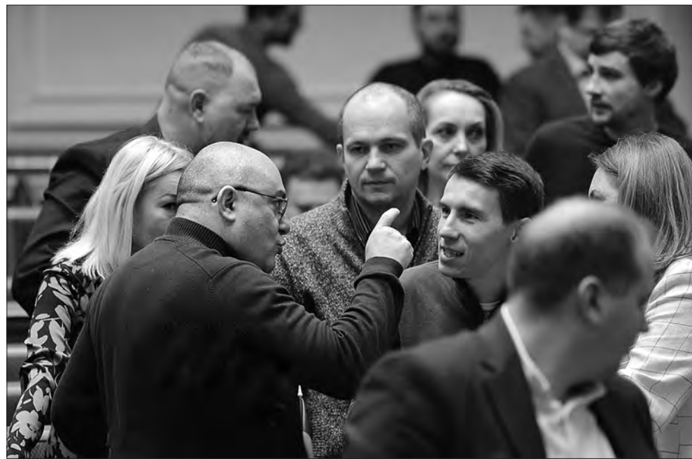
Під час засідання.

звернення до суду з позовом щодо припинення діяльності релігійної організації у разі невиконання нею приписів щодо усунення порушень, виявлених за результатами проведення релігійно-навної експертизи у встановлені строки.